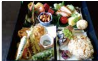
うみのべ 湖の辺づくし弁当 “高島八珍”