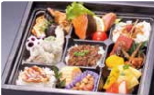
特選弁当 近江づくし“琵琶の幸”