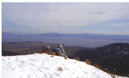
※山頂の蛇谷ヶ峰は、絶好のビューポイント！