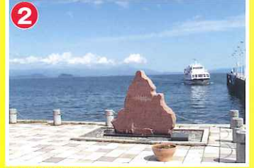
2 今津港 (今津町)