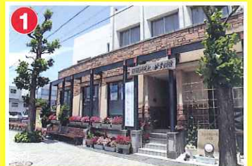
1 琵琶湖周航の歌 資料館 (今津町)