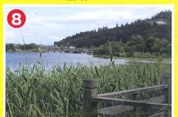
8 乙女ヶ池 (勝野)