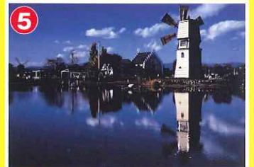
5 道の駅しんあさひ風車村 (新旭町)