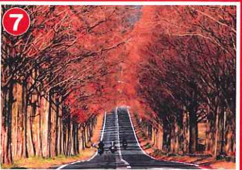
メタセコイア並木 (マキノ町)