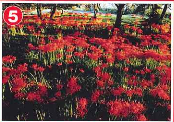
ヒガンバナ群生地 (今津町)