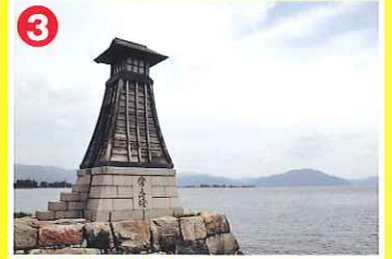
3 木津の常夜灯 (新旭町)