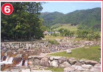
マキノ高原 (マキノ町)