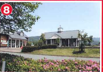
マキノピクランド (マキノ町)