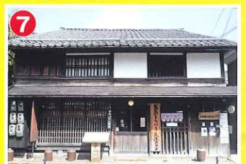
7 たかしまびれっじ (勝野)