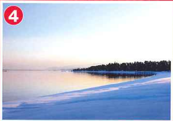
湖西の松林 (今津町~マキノ町)