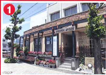
琵琶湖周航の歌 資料館 (今津町)