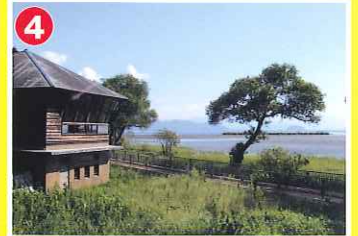
4 高島市新旭水鳥観察センター (新旭町)